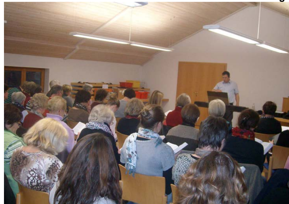
Begeistert waren alle Sängerinnen und Sänger bei der Sache

Zahlreiche kirchenmusikalisch Interessierte waren am Freitag, 14. November 2014 ins Pfarrheim Moosthenning gekommen, um aus dem reichen Schatz an neuen Gesängen, den das Neue Gotteslob aufgetan hat, zu kosten.