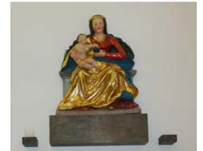
St. Maria, Moosthenning