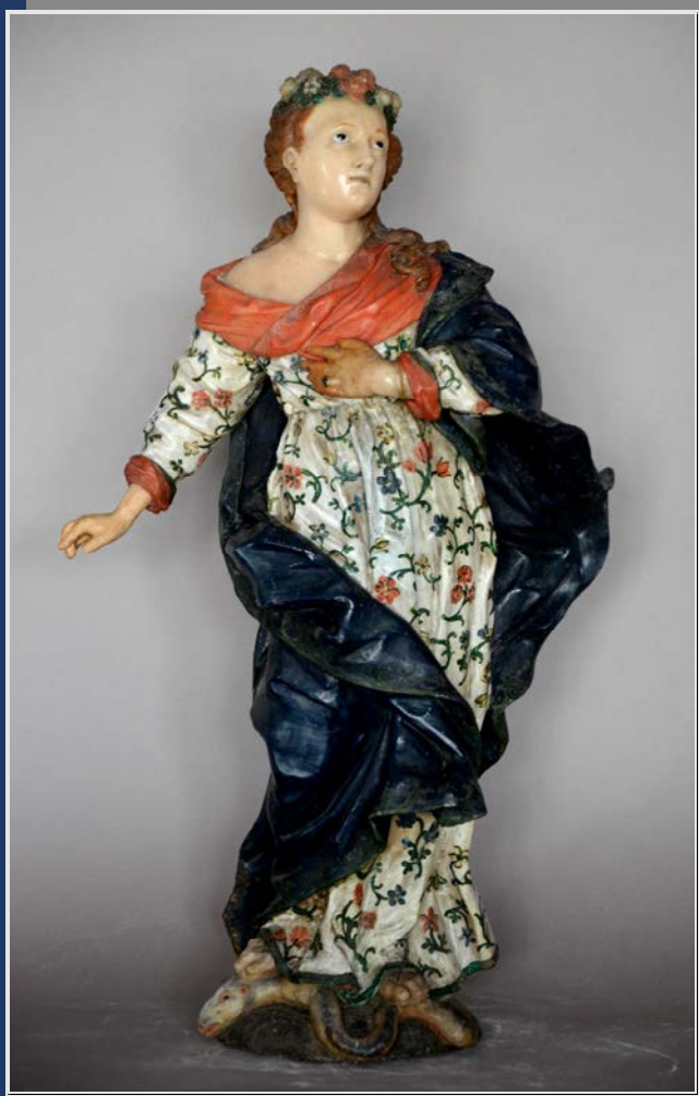
Thürnthenning: Maria Immaculata