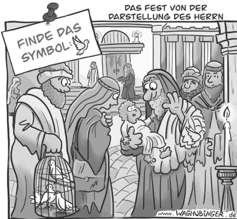
Lösung: Am linken Armel des Simeon ist eine Taube zu finden.

Simeon. Die warteten auf den Erlöser. Und tatsächlich erkannte sie in dem kleinen Jesus den Retter, und freuten sich sehr. Das seht ihr auf dem Bild. Dort haben wir noch eine dritte Taube versteckt (nicht die beiden in dem Käfig). Findest du sie?